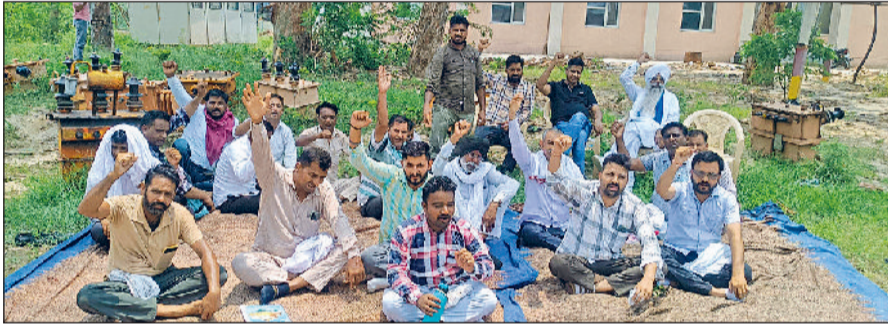
सिरसा। बैठक में सरकार के खिलाफ रोष जाहिर करते कर्मचारी।