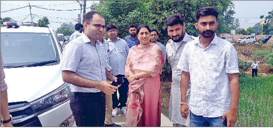
फतेहाबाद। जिला के संभावित बाढ़ क्षेत्रों का दौरा करती उपायुक्त मनदीप कौर व मिट्टी के बैग भरते हुए मनरेगा मजदूर।

पहाड़ों में बरसात थमने के बाद घग्गर के जलस्तर घट गया है। चार दिन पूर्व से यहां चांदपुरा व गुहला चौका साइफन पर जलस्तर लगातार बढ़ रहा था। शुक्रवार सुबह घग्गर जलस्तर रिकार्ड स्तर पर नीचे गिर गया। शुक्रवार को चांदपुरा साइफन पर जलस्तर 8 हजार क्यूबिक से कम होकर 3150 क्यूबिक रह गया, जिससे प्रशासन व तटबंधों पर बसे गांवों के लोगों ने राहत की सांस ली है। उधर, उपायुक्त मनदीप कौर ने शुक्रवार को चांदपुरा साइफन और अन्य बाढ़ से प्रभावित होने वाले संभावित क्षेत्रों का निरीक्षण किया। उपायुक्त ने अधिकारियों को सतर्कता बनाए रखने और राहत व बचाव कार्यों के लिए तैयार रहने के निर्देश दिए। निरीक्षण के दौरान उपायुक्त मनदीप कौर ने संबंधित विभागों के अधिकारियों को स्पष्ट निर्देश दिए कि वे बाढ़ प्रबंधन से जुड़ी सभी तैयारियों को समयबद्ध रूप से पूरा करें और किसी भी संभावित आपात स्थिति से निपटने के लिए निरंतर सतर्क रहें। उन्होंने कहा कि फिलहाल स्थिति पूर्णतः नियंत्रण में है, लेकिन एहतियात के तौर पर हर स्तर पर तैयारियां सुनिश्चित की जा रही हैं ताकि किसी भी आपात स्थिति का सामना बिना विलंब के किया जा सके। पिछली बार बाढ़ से प्रभावित रहे गांव का दौरा करते हुए उपायुक्त ने बीडीपीओ और पंचायत द्वारा गांव के चारों ओर बाढ़ से बचाव के लिए किए गए प्रबंधों की सराहना की। पहाड़ों में बरसात थमने के बाद घग्गर के