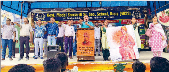
सिरसा। स्कूल में कार्यक्रम में स्वामी विवेकानंद की शिक्षाओं पर चलने का संकल्प लेते हुए।