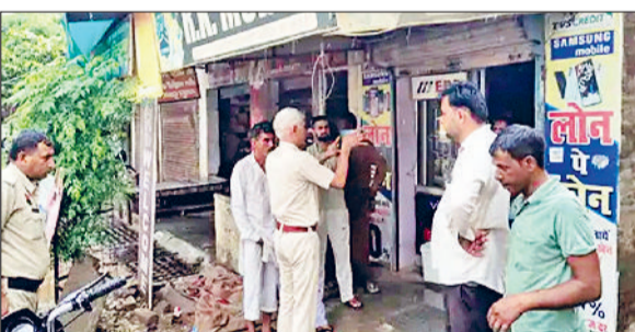
फतेहाबाद। भिरडाना में चोरी मामले में जांच करती पुलिस टीम।

शट्टर खोला तो पाया कि दुकान में सारा सामान बिखरा पड़ा था। जब उसने अंदर जाकर जांच की तो पाया कि दुकान के पीछे की दीवार भी टूटी हुई थी। दुकान मालिक ने बताया कि चोर पीछे की दीवार तोड़कर दुकान में घुसा और लाखों रुपये के मोबाइल चोरी कर ले गया है। इसके बाद उसने दुकान में लगे सीसीटीवी कैमरे को फुटेज जांची तो पाया कि एक युवक दुकान से मोबाइल चोरी