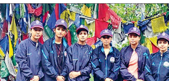
फतेहाबाद। राष्ट्रीय सेवा योजना के साहसिक शिविर में भाग लेते फतेहाबाद के वॉलंटियर्स।

उच्चतर शिक्षा विभाग, हरियाणा के तत्वाधान में हरियाणा एनएसएस सेल के द्वारा आयोजित 10 दिवसीय साहसिक शिविर में अलग-अलग जिलों से 51 स्वयंसेवक तथा 3 कार्यक्रम अधिकारियों ने हिमाचल के कांगड़ा जिले की धर्मशाला